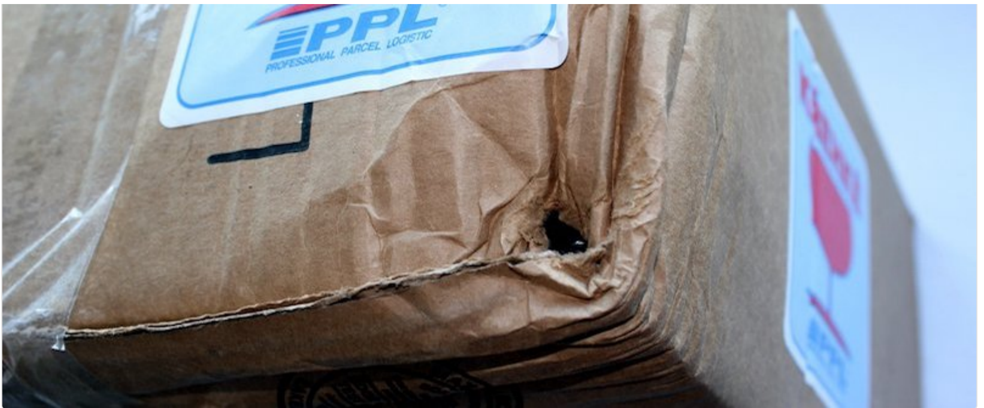
Detail adresní etikety PPL CZ/DHL.